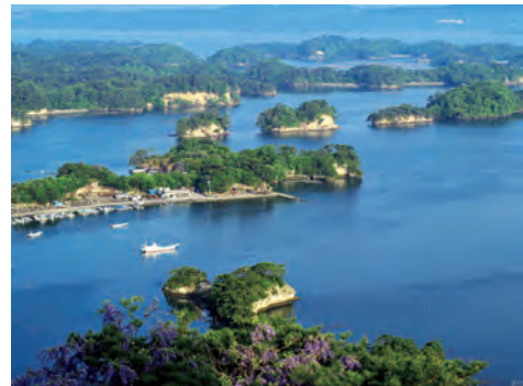
日本三景の一つ、松島

この県は、日本三景の松島で有名です。また、こけしが伝統的工芸品に指定されています。