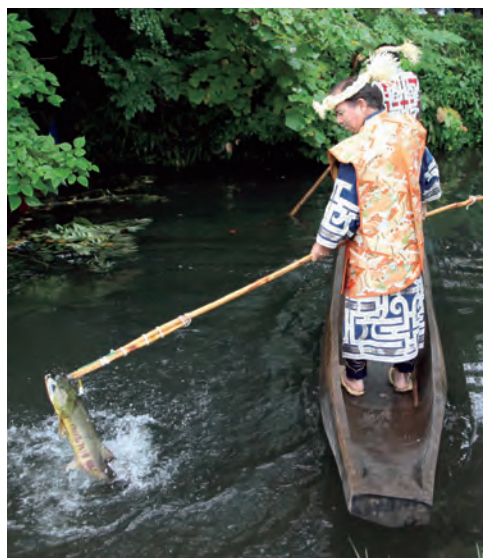
さけの豊漁を祈る儀式