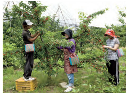
おうとうの取り入れ