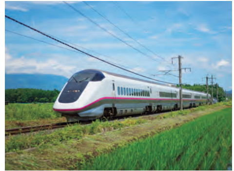
秋田新幹線「こまち」 東京と秋田を結ぶ新幹線です。

8月に行われる竿燈や、2月に子どもたちが雪の家をつくって遊ぶかまくらなどが有名です。