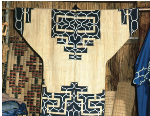
アイヌの伝統的な服

そのため、アイヌについて理解を深め、その文化を守っていく努力が続けられています。