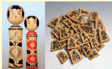
宮城県のこけし（左）と山形県の将棋の駒（右）

このうち、200種類以上の品物が、伝統的工芸品に指定されています。焼き物・和紙（72ページ）・織物・人形などがあります。