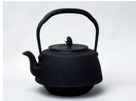
伝統的工芸品の一つ、南部鉄器

県の東部には、青森県から宮城県にまたがる三陸海岸が続いています。ここには、リアス海岸（リアス式海岸）が見られます。岩手県は、伝統的工芸品の南部鉄器でも知られています。東北新幹線を使うと、東京からは約2時間半で盛岡市に着きます。