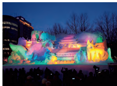
さっぽろ雪まつり (札幌市)

ゆた 豊かな自然にめぐまれた知床は、 しれとこ 世界遺産になっています。世界遺産とは、 いざん 各国が協力して守っています。世界遺産とは、 かっこく きやうりよく 各国が協力して守っていることを決めた、 しぜん たてもの 自然や建物などのことです。